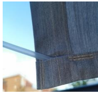
Pees in de peeszoom schuiven

Het plaatsen van een clickpees is een groot voordeel. De kunststof strip wordt i.p.v. een bovenzoom aan het doek gestikt. Doormiddel van de strip klikt u het doek gemakkelijk in de buis. Belangrijk wanneer u voor Clickpees kiest is dat er een extra slag op de bovenrol aanwezig moet zijn (minimaal 25.0 cm). De bestelde doekhoogte moet inclusief deze extra slag zijn. Tevens dient aangegeven te worden of een doek boven- of onderlangs oprolt.